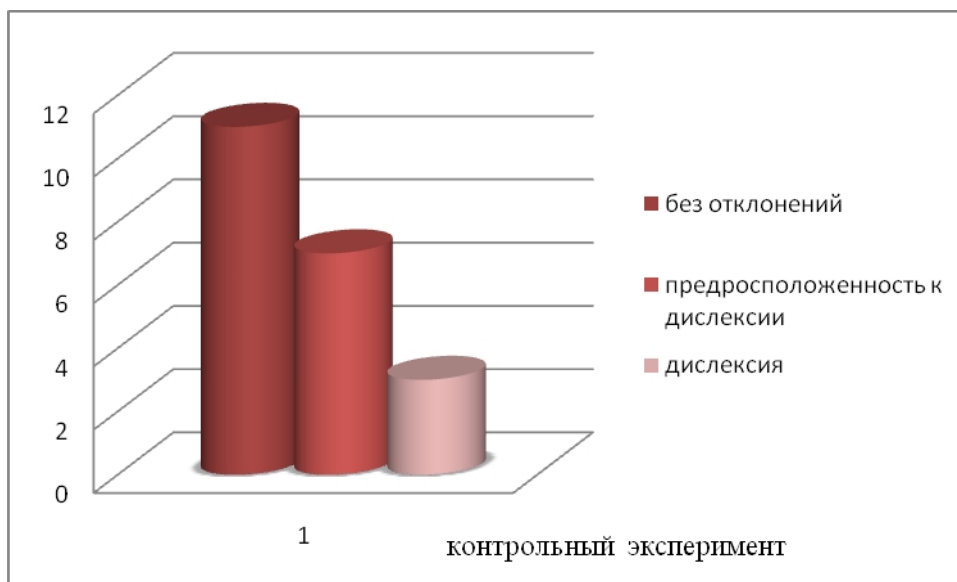
Рисунок 3. Результаты контрольного эксперимента по выявлению работы по коррекции дислексии

Сравним графически результаты констатирующего и контрольного эксперимента по коррекции дислексии у младших школьников (Рисунок 4).